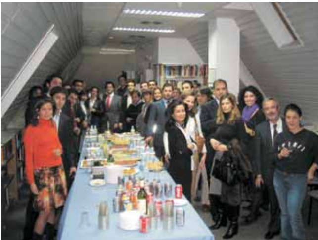
Reunión Antiguos Alumnos, 30 de Noviembre de 2006.

SLU ALUMNI Madrid Campus Newsletter se publicará de forma bi-anual. Podéis enviar vuestros artículos, fotografías y noticias a: alumni@madrid.slu.edu